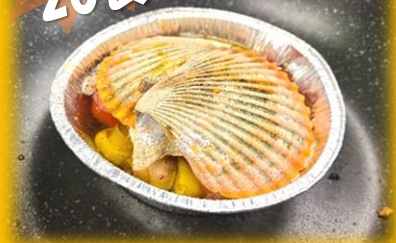
緋扇貝のアヒージョ