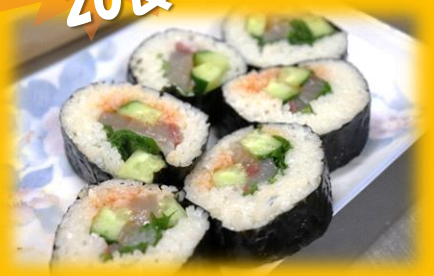
カボスヒラメの キンパ